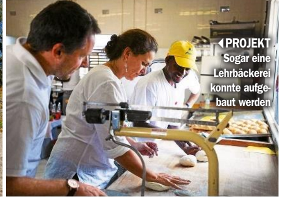
◀ PROJEKT Sogar eine Lehrbäckerei konnte aufgebaut werden